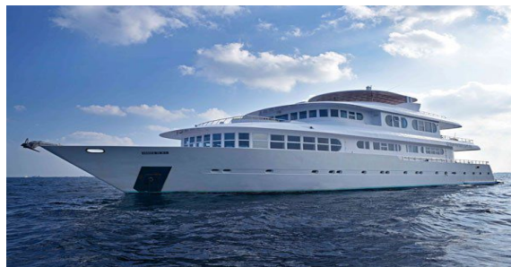
Doprovodné plavidlo Dhoni k potápění: