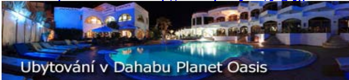
Foto Dahab a ubytování Planet Oasis: http://www.raydiving.com/gal_Egypt-Dahab.html